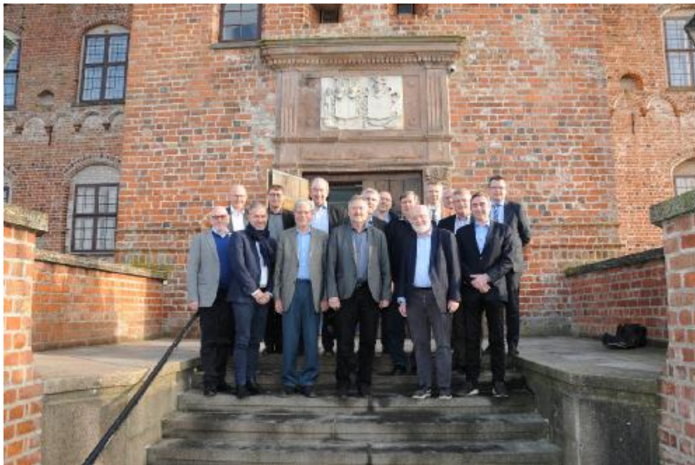
De fremmødte medlemmer af Danmarks Kartoffel Råd